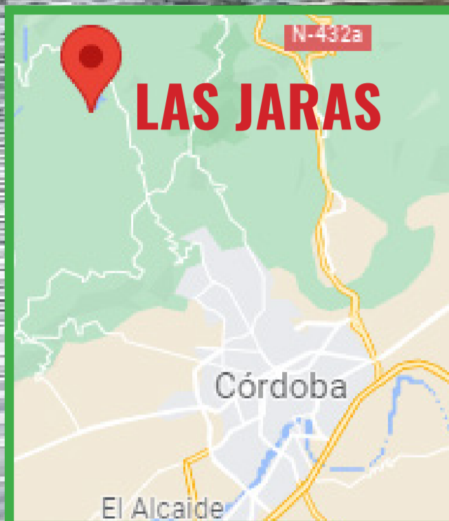
Embalse de la Encantada (Las Jaras) con evidentes muestras de contaminación.